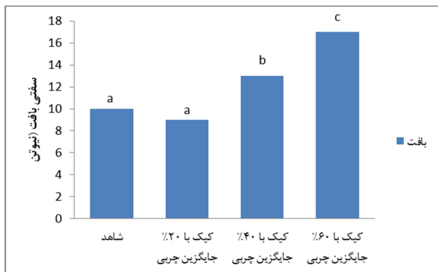
نمودار ۵- تاثیر اینولین بر بافت کیک