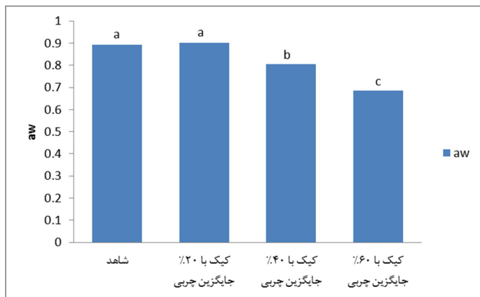
نمودار ۴- تاثیر اینولین بر aw نمونه‌های کیک

رابطه با کاهش aw کیک‌های حاوی میزان اینولین بالا می‌توان به آن اشاره کرد وجود گروه‌های عاملی از جمله گروه هیدروکسیل در ساختار شیمیایی اینولین می‌باشد. احتمال می‌رود که گروه هیدروکسیل با ایجاد پیوند با آب، میزان آب قابل دسترس را کاهش داده و بنابراین کاهش در فعالیت آبی کیک‌های حاوی اینولین ایجاد شد (Zoulias et al, 2002).