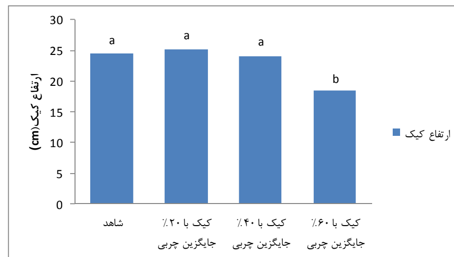
نمودار ۲- تاثیر اینولین بر ارتفاع نمونه‌های کیک

نتایج مقایسه میانگین ارتفاع نمونه کیک شاهد و نمونه‌های حاوی درصد‌های مختلف اینولین در نمودار ۲ نشان داده شده است. با توجه به نتایج بین نمونه کیک شاهد، نمونه حاوی ۲۰٪ و ۴۰٪ جایگزین چربی از لحاظ آماری اختلاف معنی‌داری در صفت ارتفاع ایجاد نشد ( P > 0.05 ) اما در نمونه حاوی ۶۰٪ جایگزین چربی کاهش معنی‌داری از لحاظ آماری نسبت به سایر ایجاد شد.